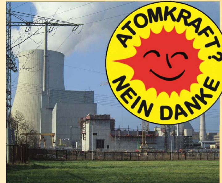
Atomkraftwerk Ohu 2

Montag, 25.06.2012 14 – 19 Uhr in München